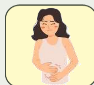
Боль в животе